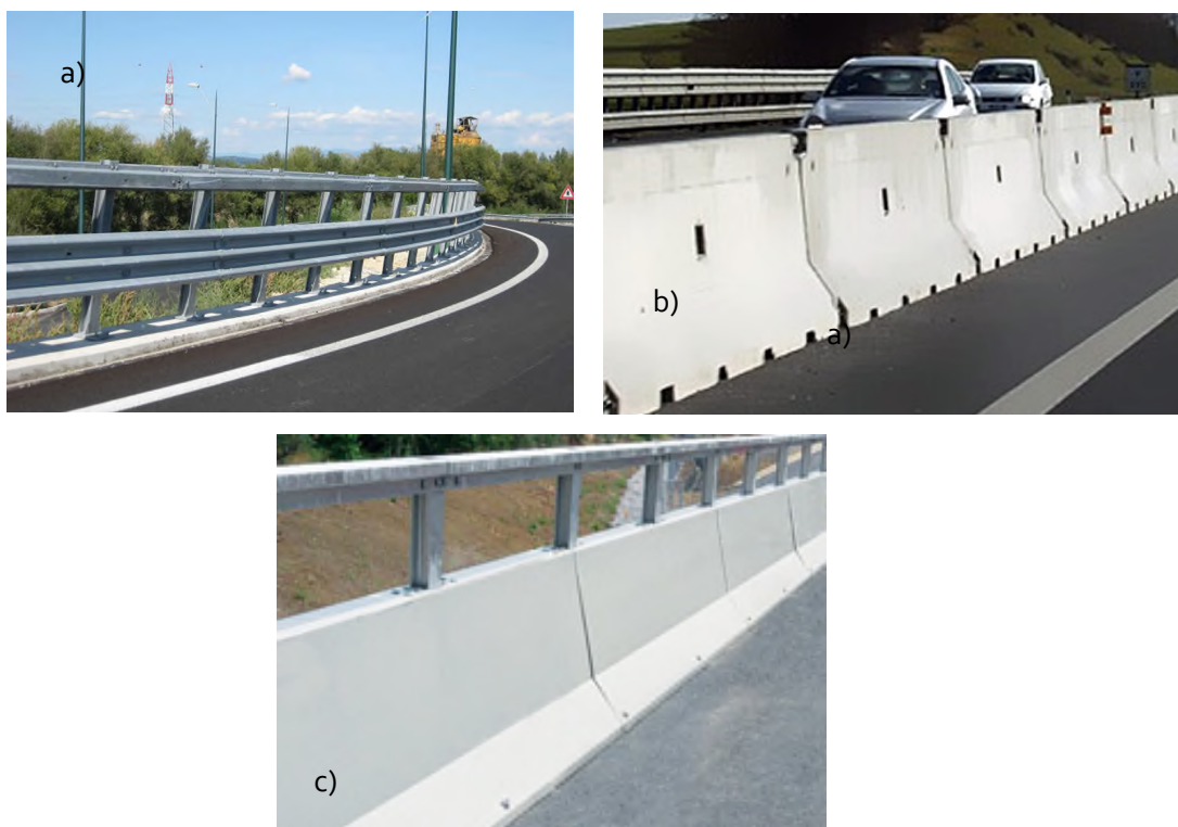
Figura 1 – Tipologie barriere di sicurezza: a) Guard Rail; b) New Jersey in c.a.; c) New Jersey in acciaio