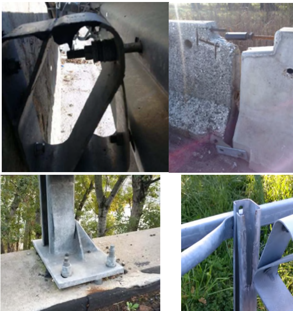
Figura 2 – Esempi di non conformità dei dispositivi di sicurezza

Occorre verificare lo stato di conservazione (o di degrado) dei dispositivi, valutando la presenza delle seguenti possibili anomalie (Figura 3):