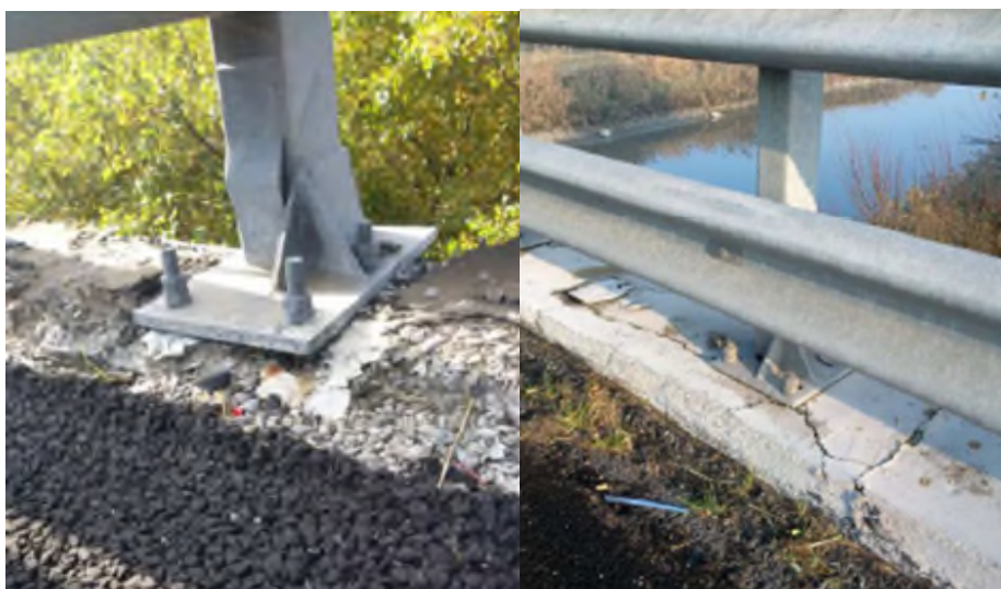
Figura 4 – Esempi di non integrità dei supporti delle barriere di sicurezza.